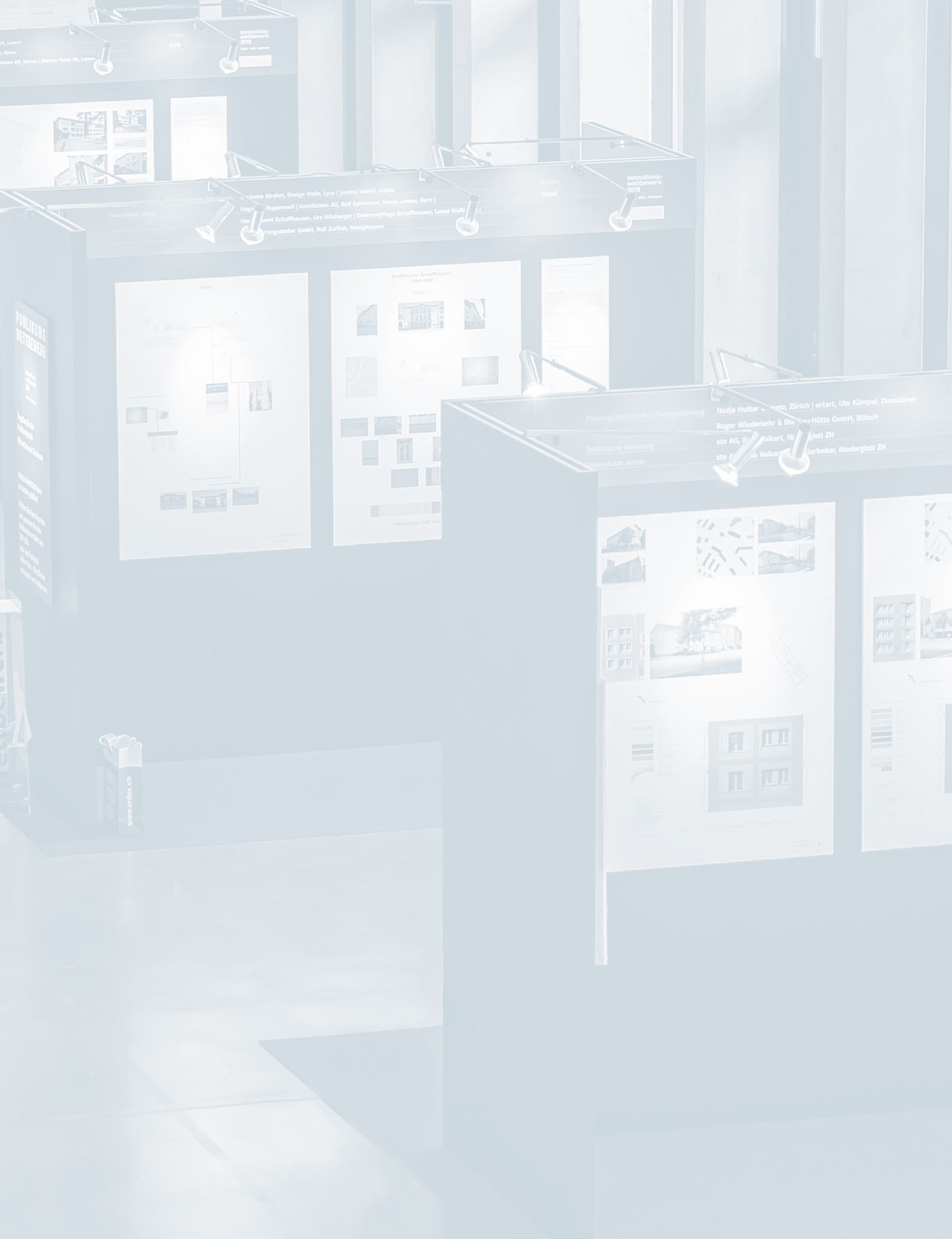
Bild: Ausstellung der Wettbewerbsarbeiten an der appli-tech 2018